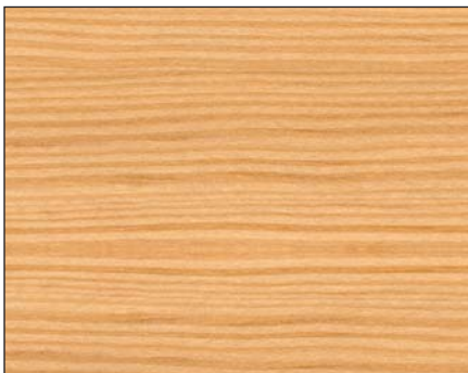
farblos* ■ clear* ■ бесцветный* Art.-No. 2400