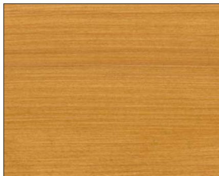
eiche ■ oak ■ дуб Art.-No. 2305