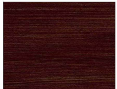
mosca ■ mocha ■ мокка Art.-No. 2306