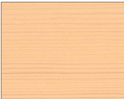
birke ■ birch ■ береза Art.-No. 2303