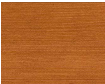
kirsche ■ cherry ■ вишня Art.-No. 2307