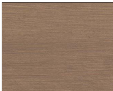
toskanagrau ■ tuscan grey ■ тосканский серый Art.-No. 2308