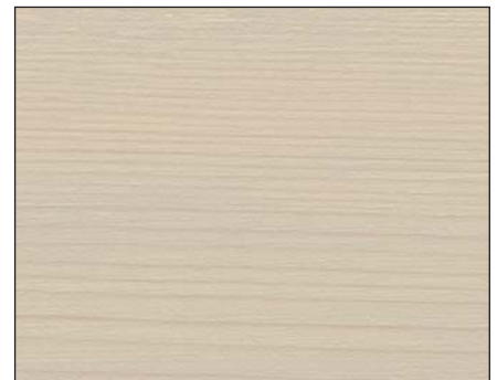
antikgrau ■ antique grey ■ античный серый Art.-No. 2302